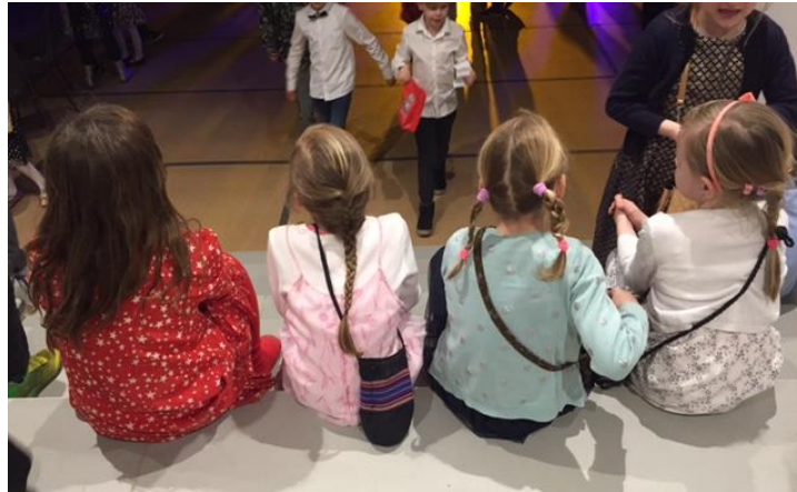
- en lille pause til dansefødderne